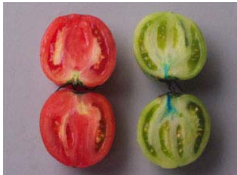
그림 2. 염색용액(methyleneblue) 수침시 조직의 염색 여부조사

토마토의 경우 상온·저온저장 모두에서 예냉처리가 무예냉에 비해 선도유지기간이 짧았으며, 높은 감모율을 보였다. 이러한 결과는 예냉중 토마토 과와 꼭지의 접합부분을 통하여 수침현상으로 인한 것으로 생각되어 실내에서 소량의 methyleneblue를 첨가한 물에서 토마토를 염색하여 보았다. 그림 2는 청색의 methyleneblue염색액이 수냉식예냉중에 과와 꼭지의 접합부분을 통하여 과육중에 착색됨을 보여 준다. 이러한 수침현상에 의해 예냉처리된 토마토의 선도가 급격히 저하되고 부패과가 발생됨으로 인해 토마토의 경우에는 수냉식예냉에는 적합하지 않은 작목으로 사료된다.