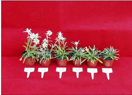
그림 3. 가온일수에 따른 솜다리 생육상

솜다리 GA처리에 의한 화경신장 효과는 처리농도가 높을수록 초장, 엽장 등이 신장하였고, 화경장이 길어지고, 화경수가 많아지며, 개화소요일수가 단축되는 경향이었으나 솜다리 분화상품의 특성상 처리농도가 지나치게 높으면 화경장이 도장하여 상품성이 저하되는 경향을 보였으며 상품성 향상을 위한 적정처리농도는 100 ~ 150mg/l 정도가 적합한 것으로 판단되었다. 그러나 처리 후 65일에는 화경장이 급격히 신장하여 상품성이 떨어지는 경향이였다 (표 5).