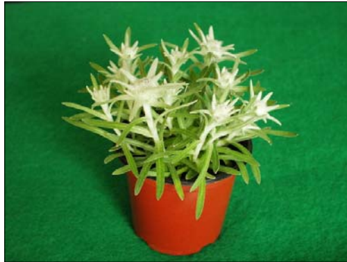
그림 4. 솜다리 분화 상품화