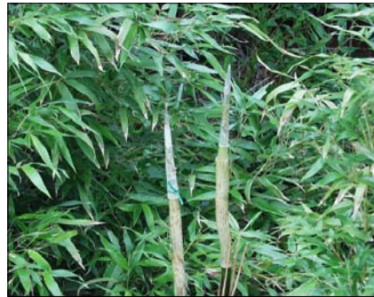
캡핑(capping) |리 방법