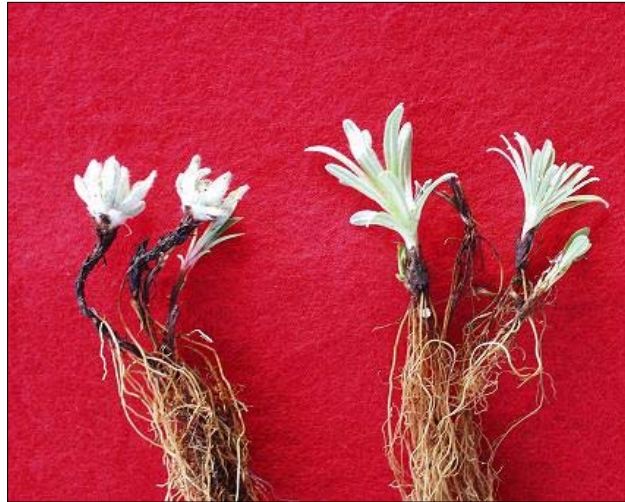
그림 1. 두메솜다리(좌)와 왜솜다리(우) 생육 비교

솜다리의 온도처리별 발아특성은 그림 2와 같다. 처리온도가 높을수록 조기에 발아하여 20℃이상 처리구에서 파종후 3~4일에 40% 이상이 발아되었으나 17℃ 처리구는 파종 후 6일, 15℃처리구는 파종 후 10일경에 발아최성기가 되었고 발아율도 저하되었다. 따라서 솜다리의 발아에 적합한 온도는 20℃내외로 판단되었다.