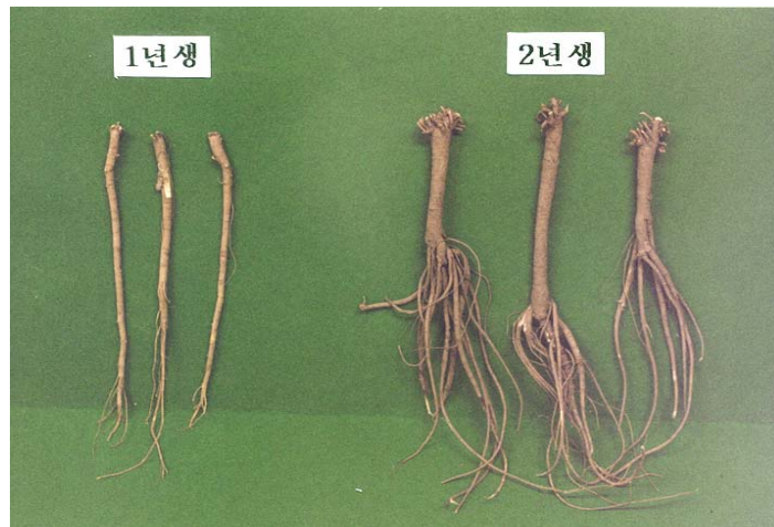
그림 2. 1년근(좌)와 2년근(우)