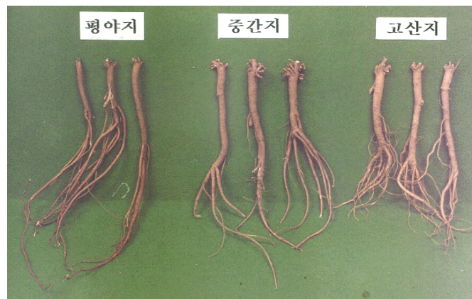
그림 3. 표고별 지하부의 생육