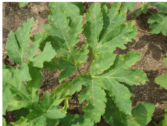
점무늬병(斑點病, Leaf spot)