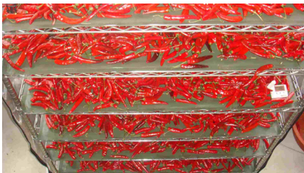
<그림 1> 선반형 건조장치 (1,200×550×1,500mm)

본 실험을 수행하기 위하여 그림 1과 같은 2종의 원적외선 직물발열체 건조장치를 제작하여 사용하였다. 선반형 건조장치의 규격은 가로 1,200mm, 세로 550mm, 높이 1,500mm이다. 매트형은 가로 1,100mm, 세로 6,600mm 이다. 원적외선 발열소재는 그림2와 같이 탄소입자가 코팅된 면직물에 내구성이 강한 방수시트를 입힌 것으로 건조장치의 규격에 따라 알맞은 크기로 재단하여 이용하였다. 각 건조장치의 건조실은 태양열을 최대한 이용할 수 있도록 투명비닐로 벽면을 구성하였으며, 벽면에 배습장치를 설치하여 건조실의 습도가 지속적으로 낮아지도록 하였다. 온도제어는 설정온도에 따라 건조실의 시료채반 및 시료에 설치한 온도 센서 (온도편차 \pm 1^{\circ}\text{C} , 조절범위 0\sim 70^{\circ}\text{C} , 소비전력 500\text{w}/\text{m}^2 )에 의하여 건조열원의 전류를 on-off 시켜 제어되도록 설계 제작하였다.