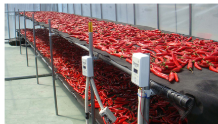
매트형 건조장치 (1,100×6,600mm)