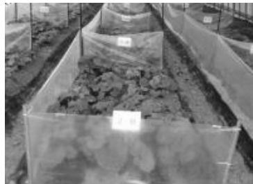
태백지역 벼룩잎벌레 약해시험 포장