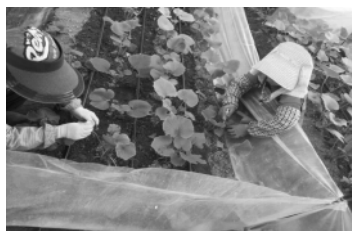
접종용 바늘구멍 뚫기