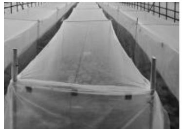
평창지역 벼룩잎벌레 약효시험 포장