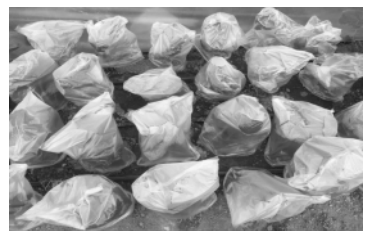
발병유도용 비닐봉지 씌우기