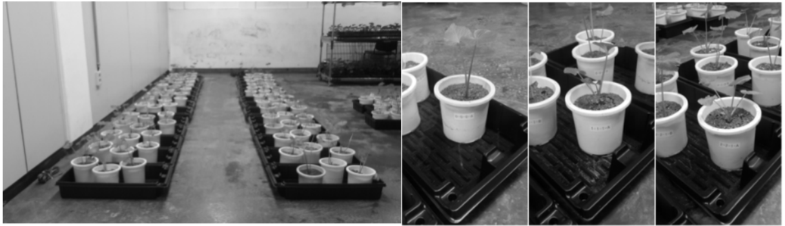
그림 1. 친환경 기준 설정을 위한 시비량 처리 사진