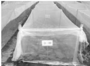
태백지역 벼룩잎벌레 약효시험 포장