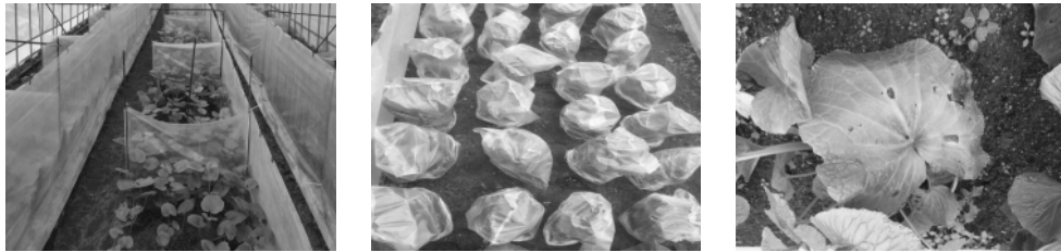
포장 전경 발병유도용 비닐봉지 씌우기 먹들이병 이병 잎

7일, 7월 17일, 평창지역은 7월 3일, 7월 13일, 7월 23일 처리하고 약해시험용 배량은 태백은 6월 28일, 평창은 7월 3일 처리하였다.