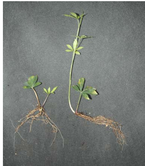
[그림 2-2] 2005년 섬오갈피 신초재분화