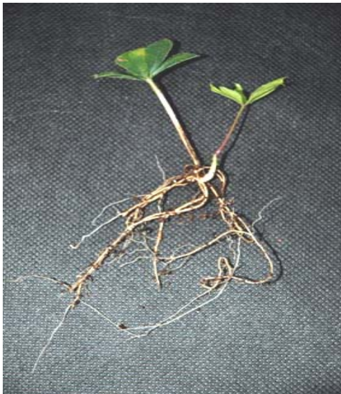
[그림 2-1] 2004년 섬오갈피 신초재분화