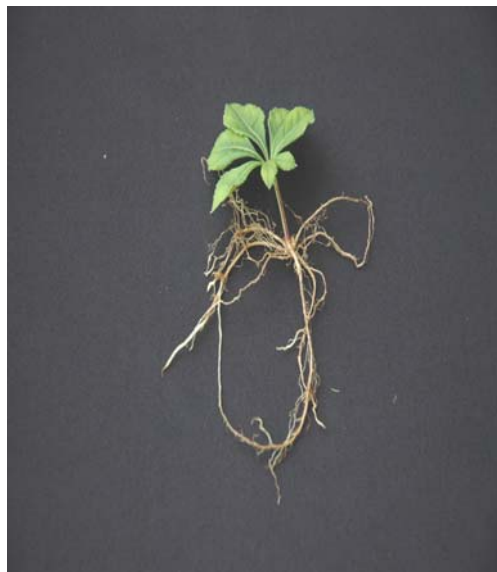
[그림 1-3] 섬오갈피 엽삼 발근 모습