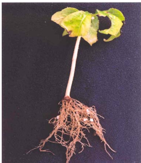
[그림 1-2] 가시오갈피 엽삼 발근 모습