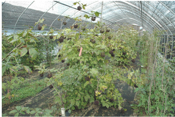
그림 2. 열매 다수확성 유망계통(GWKS030071)