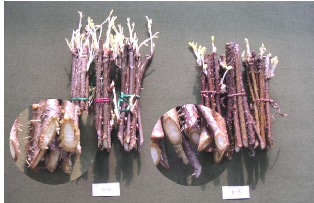
그림 4. 삼수 저장시기에 따른 발근 및 출아특성 비교

* 조사시기 : 켈러스 형성율(삼수저장 30일 후), 발근율(삼수저장 50일 후)