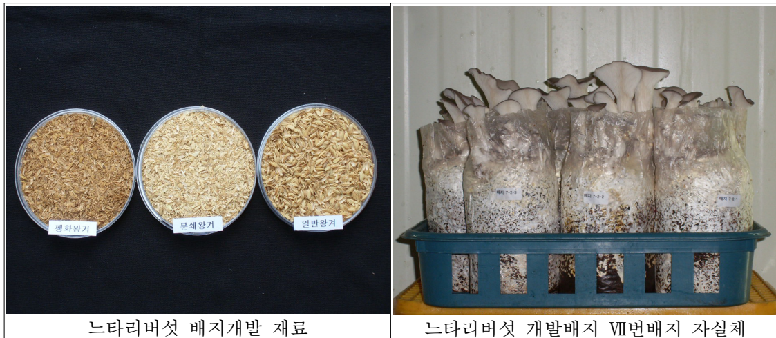
그림 2. 느타리버섯 배지개발 재료 및 우량(VII번)배지 봉지재배 자실체 수량