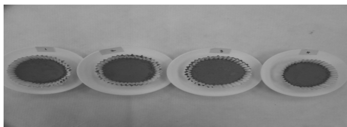
그림 6. ① 잎 블랜칭 동결건조, ② 잎 동결건조. ③잎+줄기 동결건조, ④잎+줄기 냉풍건조

* L value : +White~-Black, a value : +Red~-Green, b value : +Yellow~-Blue