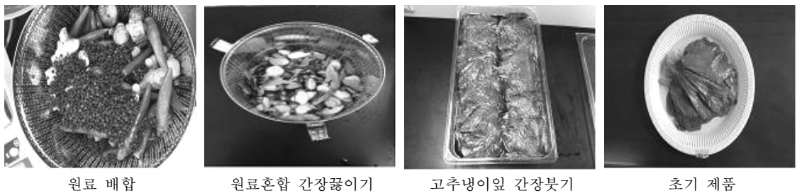
그림 3. 고추냉이잎 장아찌 제조과정(좌 →우)