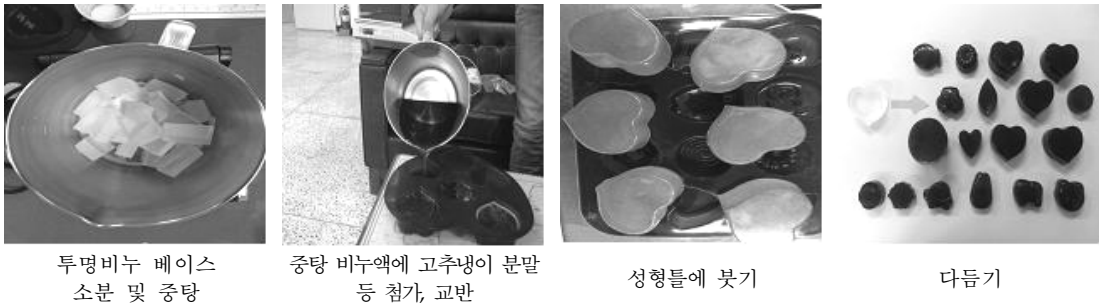
그림 4. 녹여붓기방법(Melt & Pour)에 의한 비누제조 공정

고추냉이 비누제조를 위하여 비누베이스에 고추냉이 분말을 첨가하여 녹여붓기방법(Melt & Pour)으로 비누를 제조한 결과 [그림 4], 장점은 가정에서 쉽게 제조가 가능하여 고추냉이 분말 소비시장의 창출 가능성이 있으나 단점은 여름철 고온에는 변질성이 높고 물에 쉽게 용해되는 점이 나타났다. 녹여붓기방법(Melt & Pour)으로 제조한 비누의 단점을 보완하기