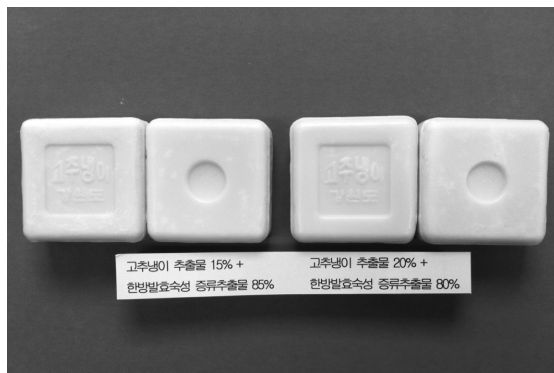
고추냉이 추출물비누 윗면 및 아랫면 그림 5. 고추냉이 추출물비누 형태