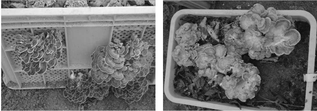
그림 3. 컨테이너상자 토양 매립시 품종별 자실체(left : 앞새1호, right : 다박)