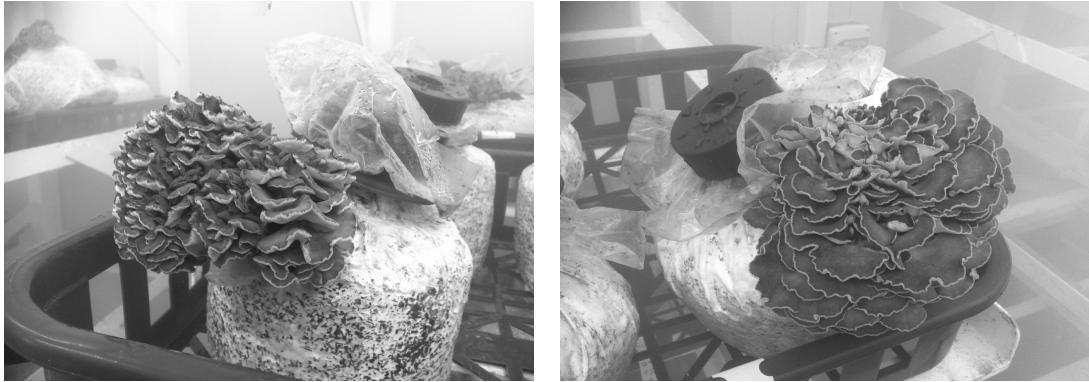
그림 1. 잎새버섯 자실체(좌 : 1kg 배지, 우 : 2kg 배지)

잎새버섯 발효톱밥 첨가효과 구명시험에서 군사배양 소요일수는 발효 참나무톱밥이나 발효 활엽수톱밥을 첨가한 처리에서 잎새1호와 함박 두 품종 모두에서 4~7일 정도 빠르게 나타났고, 수확소요일수는 함박에서는 발효참나무톱밥 첨가시 77일, 발효활엽수톱밥 첨가시 72일로서 참나무톱밥 단독처리 80일보다 3-8일 빠르게 나타났지만 잎새1호에서는 78일로서 비슷하였다(표 3). 자실체의 다발은 잎새1호와 함박 두 품종 모두에서 발효 참나무톱밥을 첨가한 배지처리가 가장 컸으며, 발효 활엽수톱밥 첨가배지, 참나무톱밥 단독처리 순으로 나타났다(표 4, 표 5). 발효톱밥 첨가에 따른 수량특성을 보면, 자실체의 다발크기와 마찬가지로 참나무 톱밥 단독처리에 비해 발효톱밥을 첨가한 처리가 모두 높은 수량을 나타냈으며, 발효 참나무톱밥을 첨가한 처리가 함박 1kg 봉지당 145.2g, 잎새1호 121.2g으로 가장 높게 나타났다(표 4, 표 5). 발효톱밥을 첨가함으로써 잎새버섯 군사생장 촉진과 수량성 증가는 잎새버섯 균이 발효 되지 않은 톱밥배지보다 발효톱밥 첨가배지에서 영양분 이용이 더 용이하였을 것으로 판단 된다. 발효 활엽수톱밥 첨가에 따른 시험관칼럼배지를 이용한 군사생장속도조사에서는 발효 활엽수 톱밥을 60%까지 증가시켰을 경우 성장속도가 점점 빨라졌으며, 이후 80% 처리구에서는 다소 낮아지는 경향이였다(표 6).