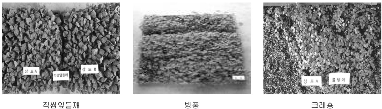
그림 2. 상토 종류별 어린잎채소 향채·산채류 생육 상황

※ 파종일 : 2014. 6.16, 파종판 : 300×600×33mm(W×L×H)