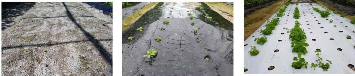
그림 5. 육묘 및 직파시험구