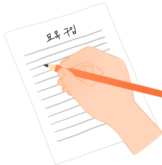
구입기록 작성 및 보관

종자산업법에 따른 유통·판매이력제에 따라 생산·관리된 묘목을 사용하고 구입기록을 작성 및 보관하기