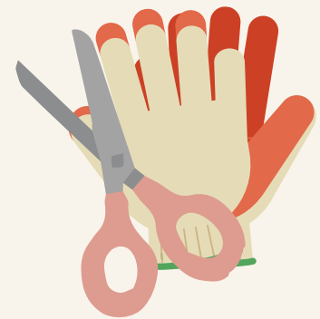
장갑, 가위 등의 작업도구

작업도구는 70% 알코올 또는 일반락스 20배 희석액을 이용해 분무 또는 10초 이상 담그기