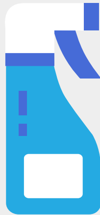
일반락스 20배 희석액