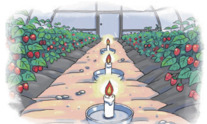
정전, 온풍기 고장시 양초·알코올 등 응급조치

응급대책 활용시 화재 위험성 및 산소부족으로 불이 꺼질 수 있으므로 세심한 관리 필요