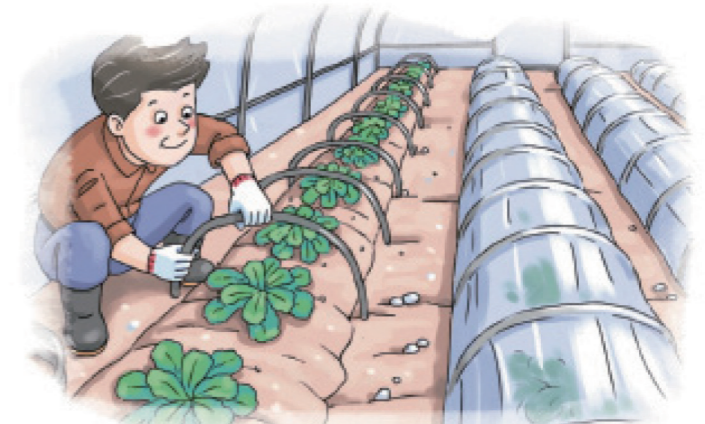
시설파손, 저온피해 우려시 소형터널 설치