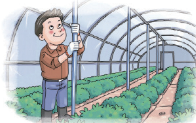
노후화된 시설 등은 보강지주 설치

외부 창을 닫고 온풍기 등 가온시설 정상작동 확인, 정전 시 난방기 고장에 대비 응급자재(양초, 알코올 등) 준비