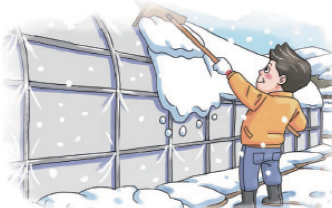
하우스 위 눈 쓸어내기