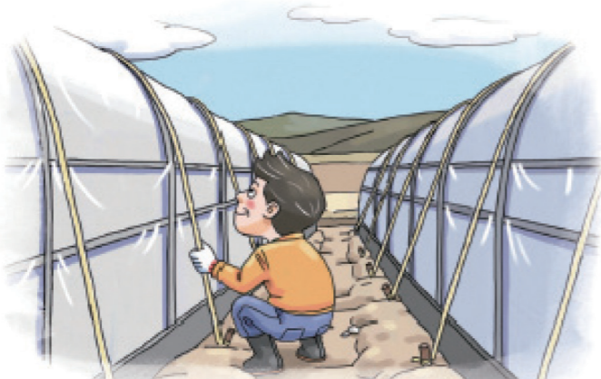
시설하우스 고정끈 설치 및 보강