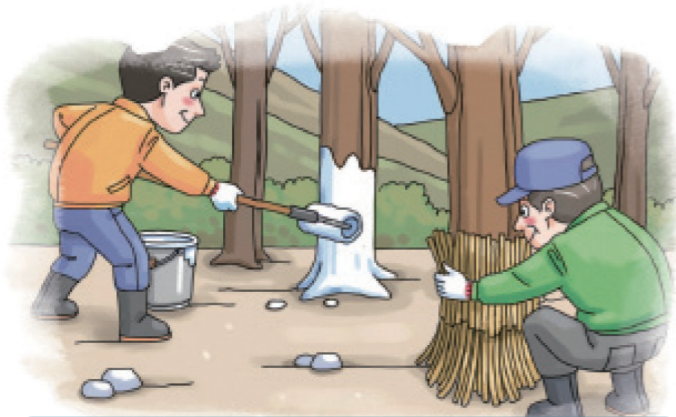
과수주간부 벗짚피복 또는 수성페인트 칠하기